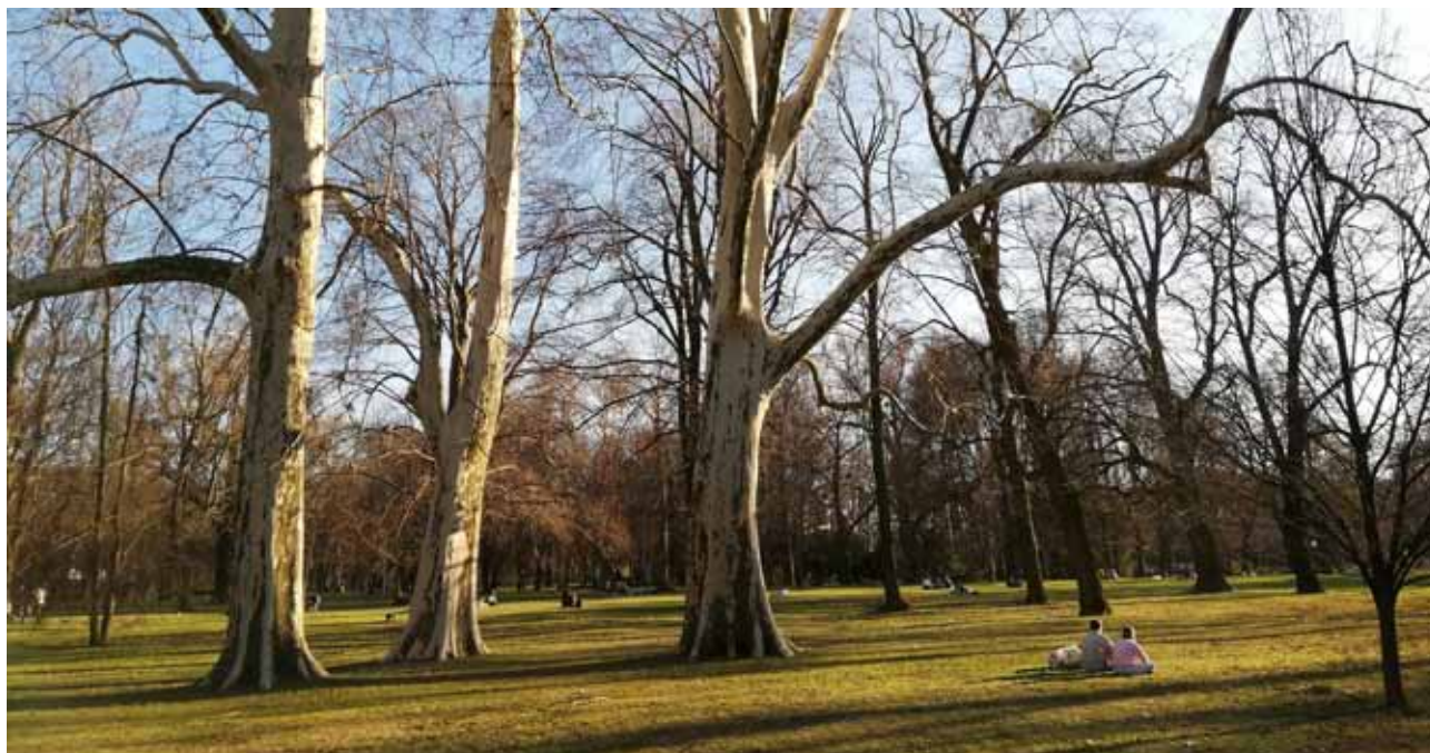
Veľké mestské parky sú nevyhnutné pre kvalitný oddych nielen obyvateľov, ale aj návštevníkov (Sad Janka Kráľa v Bratislave, marec 2019).

Ústav krajinnej ekológie Slovenskej akadémie vied, Štefánikova 3, P. O. Box 254, 814 99 Bratislava