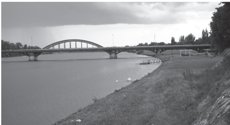
Obr. 1. Rieka Váh (2006).

Vektorizované mapy boli využité na ďalšie podrobné štatistické vyhodnotenia mapovaného územia. Spomínané mapy umožnili určiť, aké veľké plochy zaberajú jednotlivé krajinné prvky a v ktorej časti mapovaného územia. Na základe výsledných štatistických údajov