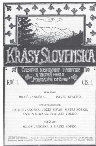
Krásy Slovenska – prvý ročník a prvé číslo z roku 1921

V roku 1938, po rozdelení Československa, začal vydávať Krásy Slovenska novovzniknutý Klub slovenských turistov a lyžiarov. Nasledujúce vojnové roky ovplyvnili aj vydávanie časopisu. Po ideovej stránke, až na pár článkov, však zostal politicky neutrálny.