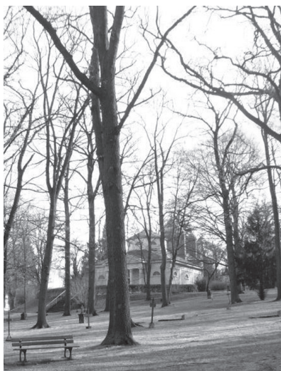
Weimarský Historischer Friedhof.

vyrástla, jeden z nich chátra a čoskoro bude nad ním viesť diaľnica.