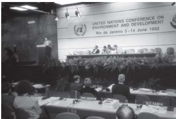
Plenárne vystúpenie Josefa Vavrouška, vedúceho československej delegácie na Summite Zeme v Riu de Janeiro.

v matčině lůně by také nebylo vítězstvím, kdyby přišlo na způsob, jak se vyhnout cestě do nejistoty – porodu, a zůstat v těle matky napořád.