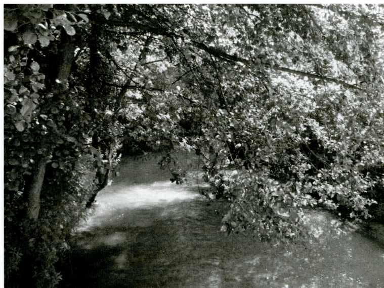
Regionálny biokoridor Potok Pružinka s brehovou vegetáciou.

diverzitu a stabilitu územia medzi biocentrom Ostrá Malenica a biokoridorom regionálneho významu Pružinka. Príľahlé svahy toku tvoria mozaiky lesov, nelesnej drevinovej vegetácie, ovocných sádov a trvalých trávnych porastov extenzívne využívaných, ktoré patria v území k ekologicky významným krajinným prvkom.