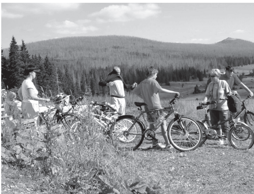
2. Turisté v CHKO/NP Šumava.

• Chráněná krajinná oblast Třeboňsko (65 záznamů) se také v tisku prezentovala spíše bezkonfliktně . Medializované případy střetů mezi ochranou přírody a ekonomickým rozvojem území se týkají, stejně jako na Křivoklátsku, především fungování samotných obcí. Každou zimu se v tisku například diskutuje o údržbě silnic, neboť v CHKO není možno v době náledí používat sůl. Inertní posypy však způsobují ucpávání kanalizace obcí. Na rozdíl od Křivoklátska byl však v případě Třeboňska mediální obraz vztahu ochrany přírody a rozvoje obcí rozšířen i o problematiku provozu místních výrobních odvětví. A to zavedených, jako je rybníkářství, těžba šterkopísků a lázeňství, i nově se konstituujících, jako je čerpání vody z hlubinných vrtů a turismus. Ne vždy jde o střet mezi správou