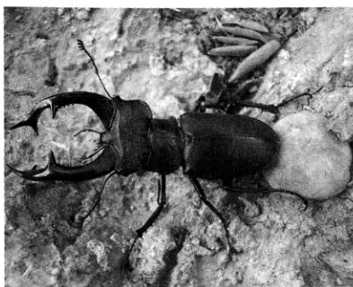
Roháč obyčajný, európsky významný druh Zobora