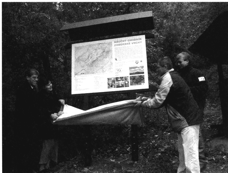
Otvorenie Náučného chodníka Zoborské vrchy.

Okrem prezentácie výskumnej činnosti a praktickej ochrany prírody na území CHKO Ponitrie za