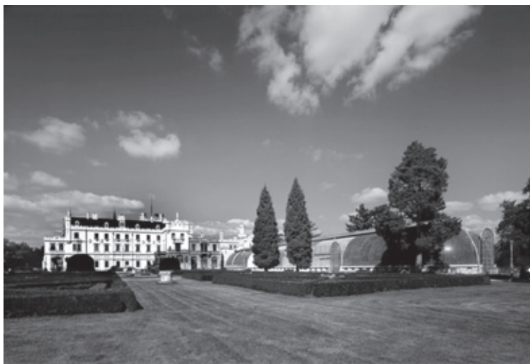
1. Lednice – partner před zámkem bude letos doplněn o automatickou závlahu. Palmový skleník obdržel r. 2003 cenu za rekonstrukci v soutěži Grand prix obce architektů.

Poválečné období znamenalo pro objekt spíše stagnaci. Prvotní erudované zásahy obohatily park o nové druhy, až na výjimky byly pokračováním v principech