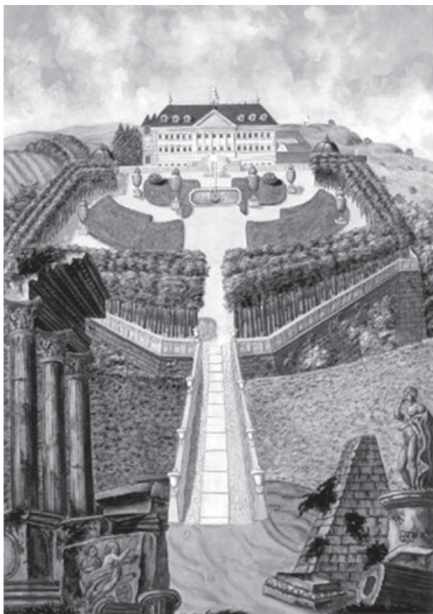
2. Formální zahrada ve Valticích v r. 1793. Codex Liechtenstein

především tvůrců. Po odchodu profesora Scholze se pro nedostatek financí péče omezovala spíše na udržování stavu.