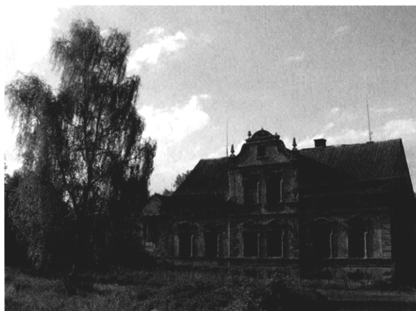
Jedním z problémů vnitřní periferie západního Rakovnicka je devastace bytového fondu (Vrbice, květen 2004).

Změna politického systému po r. 1989 a působení transformačních procesů se projevilo i změnou geografické diferenciacie území. Zásadní obrat v polarizačních tendencích vyvolal pád umělých bariér a rostoucí význam sousedství ČR se zeměmi Evropské unie.