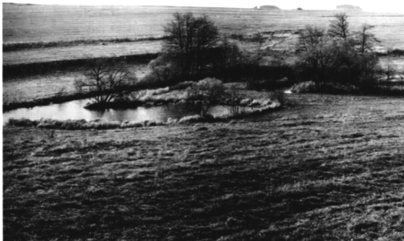
Přirozený ráz vodního toku.

Koncepce protipovodňové ochrany vychází z analýzy historických povodní od r. 1883. Hlavním cílem této analýzy bylo prověření toho, jak se chová povodí Moravy a Bečvy, jak se vytváří a vyvíjí povodně. Průběh povodně na těchto řekách významně ovlivňuje rychlost postupu povodňové vlny, transformace povodňové vlny v inundačních prostorech a střetávání povodňových vln na soutocích větších řek.