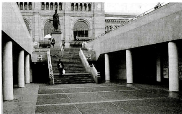
Hannover: Spodné podlažie pešej zóny vedie popod železničnú stanicu až po jednotlivé nástupištia