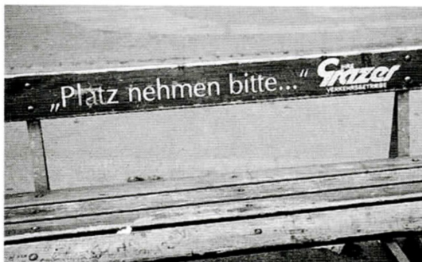
Graz: Prívetivosť mestského mobiláru

Až teraz možno zreteľne povedať, že hypotéza urbánnej slušnosti nesmeruje k nejakým novým "jemnejším" variantom normatívnej teórie mesta, ako sa o ňu pokúsil Kevin Lynch (1981), keď zo všeobecnej hodnotovej požiadavky vhodnosti na život vyvodzoval ďalšie hodnotové parametre mesta, ako bezpečnosť , súlad človeka a prostredia, významovosť , čitateľnosť , spoznatelnosť , zhoda medzi objemom priestorov a objemom činností, dostupnosť , kontrolovateľnosť , efektívnosť a spravodlivosť distribúcie statkov a hodnôt na základe princípov rovnosti, potrieb, schopností, sociálnej pozície, platobnej schopnosti a pod. Normatívna teória sa pokúsila zjednotiť popri metrických, kvantitatívnych charakteristikách aj hodnotové, kvalitatívne určenia, striktnosť územného plánu s niektorými princípmi urbánnej demokracie. Práve tieto prepojenia sa stali jej konfliktnými miestami. Z iných východísk dospel k rovnakým protirečeniam aj Leon Krier (2001) vo svojom pluralitnom polycentrickom modeli mesta s možnosťami voľby, ktorý on sám považuje za jedno z možných demokratických usporiadaní, vo chvíli, keď sa ho usiluje zlúčiť s územným plánom zakotvujúcim povinnosť určovať v každej štvrti sieť ulíc s námestiami, bloky domov, miery a tvary parciel, aj počet, tvar a funkcie poschodí, architektonický kód materiálov, technických riešení, ako aj kód stavieb a pries-