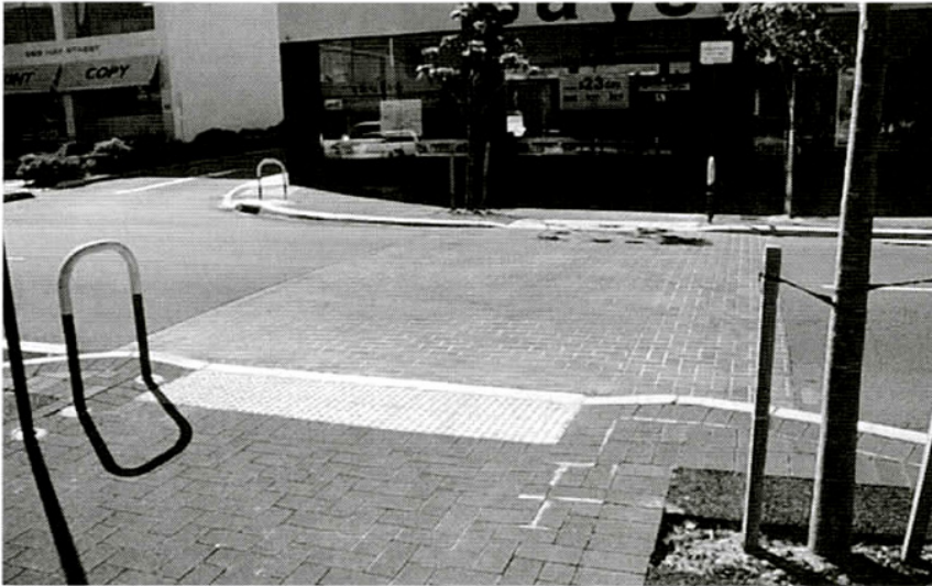
Predmestie Perthu: Právo "slabšieho" v dopravnom systéme. Bezbariérový prechod s miernou prekážkou pre "silného" – automobilovú dopravu.