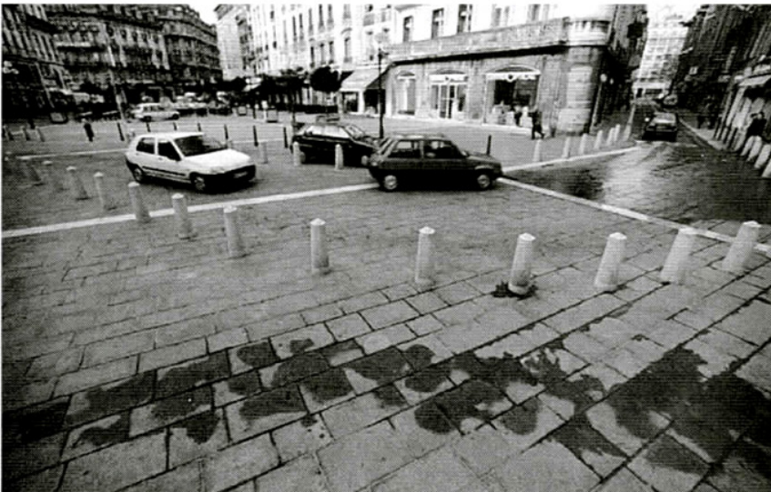
Grenoble: Mesto vyčleňuje pešiu zónu pre slabších, ale neobmedzuje, hoci usmerňuje vstup automobilom

mesta, napr. dopravného systému k pešej zóne alebo námestiu, novostavby k uličnej čiare, architektúry expandujúcej firmy k drobným architektúram pôvodného mestského osídlenia, dominant k obrazu alebo panoráme mesta atď. Predpokladáme, že uvedené súvislosti zrejme možno z fenomenologického, kvalitatívneho pohľadu označiť polaritou slušné a neslušné . Všade tam, kde