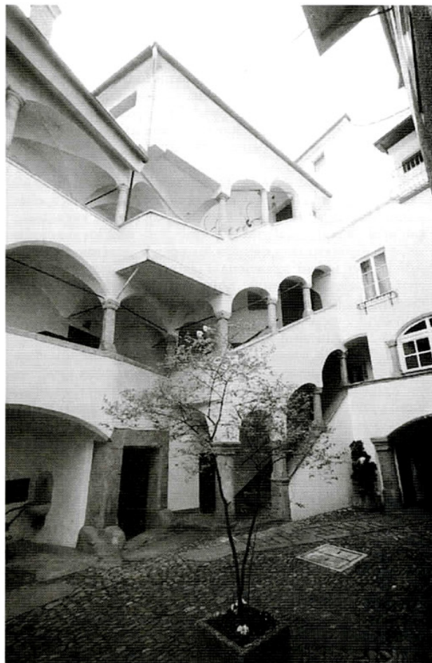
Graz: Neotrocké rešpektovanie historickej architektúry v súčasnej výstavbe, slušnosť súčasného voči historickým vzorom

Formy zdvorilosti a slušnosti môžu mať podobu nepísaných zvyklostí, ale môžu získať aj podobu kodifikovaných pravidiel ceremoniálov a etikety, v ktorej sa prirodzené vzdávanie úcty môže meniť na vzdávanie úcty vznešenejšiemu, významnejšiemu, silnejšiemu. Aj keď sa to dnes dá len ťažko a zložito dokazovať, možno