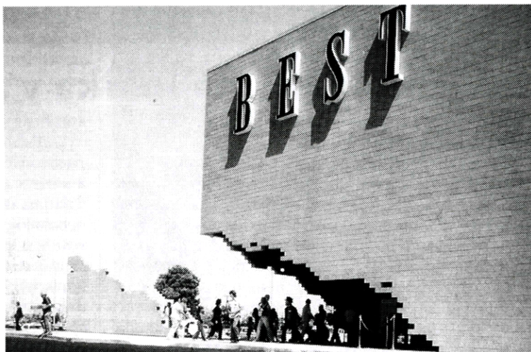
5. Kult tanatológie v 20. storočí. Ruina, koniec architektúry ako firemná reklama. Obchodné domy firmy Best od zoskupenia Site a J. Winesa. Kalifornia, 1977.

Medzi prírodné vonkajšie konce by sa mohlo zaradiť postupné fyzické opotrebovanie rozmanitých druhov,