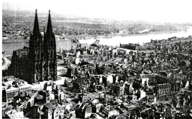
3. Morfe, bios a logos v rozbombardovanom Kolíne nad Rýnom r. 1945. Vonkajšia násilná smrť architektúry.

grafií a filmov, v ktorých sme konfrontovaní s rozpadajúcimi sa domami, ruinami historických pamiatok, rozbombardovanými štvrťami, zničenými mostami, nakláňajúcimi sa vežami, riadenými explóziami budov, pomaly sa topiacimi mestami), neexistuje žiadny systematický opis druhov a spôsobov ich zániku.