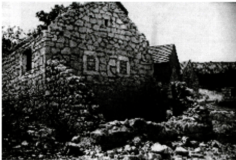
2. Prirodzené smrte a život prírody. Viac života a menej formy. Diderotovská tanatológia. Okolie jazera Buško Blato v Juhoslávii.

Architektúra môže dočasne zaniknúť vtedy, keď je pohltená inými neshpecifickými činnosťami, napr. ideologicky proklamovaným projektovaním, alebo vtedy, keď nenachádza z rozmanitých príčin objednávateľa. Pokiaľ architektúra napriek mnohým krízam preukazuje svoju životaschopnosť, má architektonické dielo večný život len ako ideálna alebo intencionálna entita. Vo všetkých iných aspektoch: prírodných, technicko-technologických, sociálnych i kultúrnych má architektonické dielo rôzne ohraničenú dĺžku svojho trvania: vykazuje špecifické parametre životnosti, ktorá sa najvýraznejšie prejavuje na jeho fyzických vrstvách. Koniec a smrť architektonického diela možno opísať ako nezvratný proces rozpadu jeho určitých vrstiev alebo celku, ktorý napriek vnútornej súvislosti života a smrti od zrodu po zánik, má protikladné vlastnosti ako život. Keďže dodnes si teória ani história architektúry nekladli tanatologické otázky (hoci každý sa rozprávame na obrázky vlastnej skúsenosti alebo z foto-