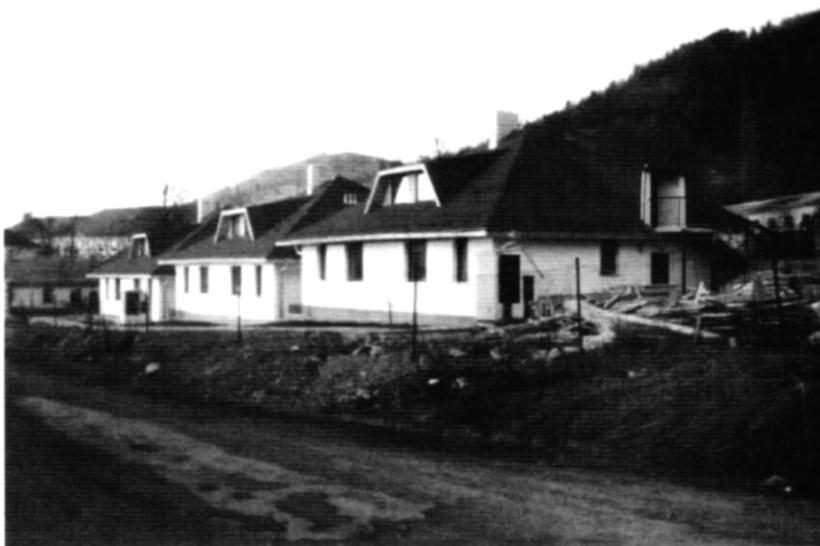
"Jazerný dvor" – sociálne bývanie v Kremnici pre 4 rómske, 4 nerómske rodiny a krízové centrum

Miestna skupina SPOLU v Kremnici sa r. 1966 po konzultáciach s holandskou organizáciou One Europe Foundation rozhodla vytvoriť sieť projektov, ktorú by spájali podobné ciele a princípy. Projekt sa v určitých modifikáciách preniesol do ďalších lokalít: Plavecký Štvrtok, Lomnička, Prešov, Licince, Humenné, Snina. Miestna skupina v Kremnici sa stala istým centrom, sprostredkúva finančnú podporu i komunikáciu medzi týmito lokalitami. Okrem riešenia sociálnych problémov, edukácie a pod., v rámci projektu SPOLU vzniklo Združenie na podporu sociálneho bývania, jeho činnosť podporujú zahraničné (holandský vládny fond MATRA) i domáce subjekty (ministerstvá, miestne inštitúcie a pod.). Činnosť sa zameriava na konkrétnu lokalitu Kremnica, avšak jej pôsobnosť v realizácii cieľov je celoslovenská. Program "výstavba domov" zahŕňa výstavbu nových hlinených domov podľa špecifických projektov s ohľadom na rómsku mentalitu. V Kremnici sa v prvej fáze projektu postavili 3 domy s deviatimi bytmi, v ktorých bývajú 4 rómske a 4 nerómske rodiny, jeden byt je krízové centrum. V súčasnosti sa