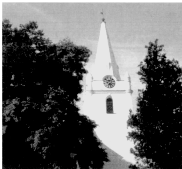
Kostel sv. Jana Křtitele v Telnici

Každý, kdo se účastní procesu zajištění takových dotací dobře ví, jak je obtížné vyčlenit z obecního rozpočtu nejméně oněch 40 % podílu obce na celkové investici, když dobrovolnou práci občanů zadarmo dnes už není možno žádat a prikazování skončilo na vesnici dokonce už nějakou dobu před listopadem. Přesto se realizace akcí dotovaných z Programu obnovy venkova v řadě obcí daří. Tam, kde se vesnice dlouhodobě nezadlužila