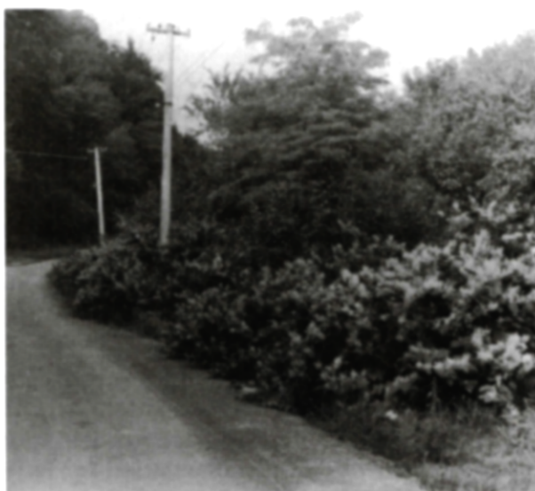
4. Krídlatka japonská ( Reynoutria japonica ), pestovaná v záhradách sa šíri pozdĺž ciest (obr. hore). Vegetatívne sa dobre rozmnožuje a vytvára husté porasty (obr. dolu).