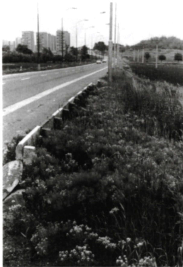
2. Hustý porast vesnovky obyčajnej ( Cardaria draba ), ktorá sa rozšírila do Európy z Ázie