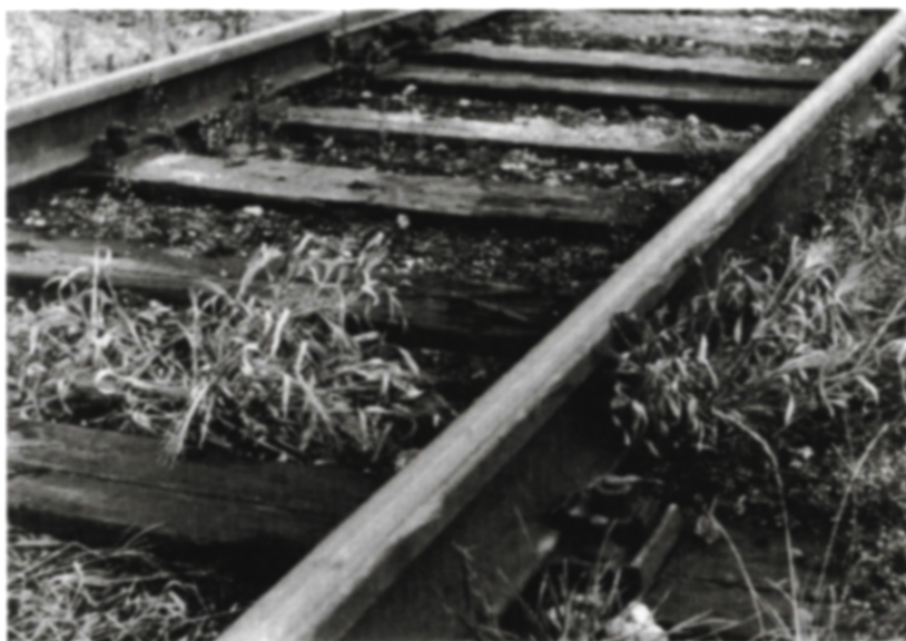
3. Na koľajiskách sa vyskytuje proso vláskovité ( Panicum capillare )

stupne rozšírili aj európske druhy iných rastlín. Na Nový Zéland a do niektorých štátov USA sa tak dostala u nás domáca rastlina ľubovník bodkovaný ( Hypericum perforatum ) lodnou dopravou. Obsadila obrovské množstvo úrodnej pôdy a stala sa vážnym poľnohospodárskym problémom.