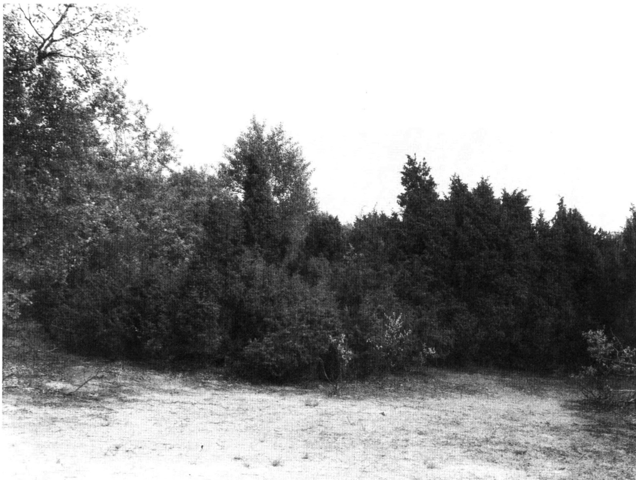
Zařazení národního parku „Kiskunság“ (na snímku porosty jalovců na písčných dunách) do V. kategorie vyvolalo v Maďarsku velké protesty – důkaz potřeby určité revize mezinárodních kritérií

obyvatel i návštěvníků chráněných území, t. j. posilovat interpretaci přírodních i kulturních hodnot a ekologickou výchovu.