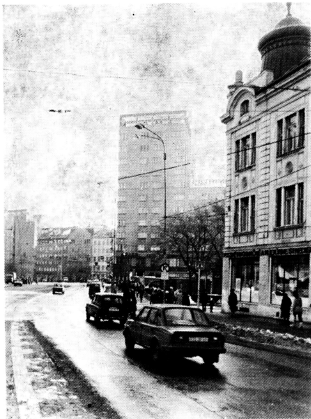
Obr. 1. Každé mesto má (resp. by malo mať) svoju charakteristickú tvár, svoj typický obraz a „čitateľnosť“. Bratislavský „manderlák“ je jedným z rozhodujúcich orientačných bodov pre návštevníkov mesta.

ty jeho obrazu v danom objektívnom prostredí pri maximálnom využití a zhodnotení všetkých daností, ktoré toto prostredie na tvorbu ponúka.