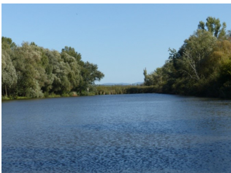
Obr. 3: NPR Parížske močiare (Moyzeová, 2019).

V súlade s PHSR a ÚP medzi silné stránky pre rozvoj územia patria výhodná poloha, klíma, reliéf, pestrá krajinná štruktúra a vysoký prírodný potenciál. Ďalej je to dobrá želez-