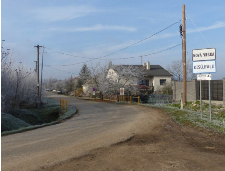
Obr. 1: Nová Vieska (Moyzeová, 2020).