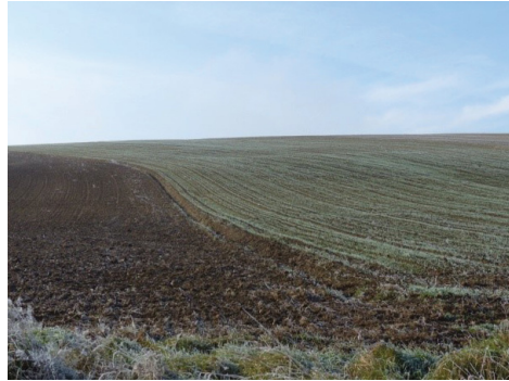
Obr. 2: Veľkobloková orná pôda (Moyzeová, 2019).

Z celkovej výmery územia najvyššiu rozlohu má krajinný prvok orná pôda 1 127,6 ha (Obr. 2, Graf 1 Prvky krajinej štruktúry). Najväčšiu časť ornej pôdy aj v súčasnosti obrába Poľnohospodárske družstvo (PD) Hangáš Nová Vieska (JRD bolo v obci založené v roku 1949). Okrem PD Hangáš je v obci evidovaných 11 samostatne hospodáriacich roľníkov (SHR). V súčasnosti v obci žije 656 obyvateľov z toho je 326 mužov (49,7 %) a 330 žien (50,3 %). Ekonomicky aktívnych je 336 obyvateľov (51,2 %). Z národnostného hľadiska v obci prevažujú obyvatelia hlásiaci sa k maďarskej národnosti. Z náboženského vyznania v obci dominujú kalvíni (64,2 %). Priemerný vek obyvateľov je 45,79 rokov (SOBD, 2021). Nová Vieska patrí k obciam s bohatou históriou, ktorá siaha až do obdobia neolitu (Adamová a kol., 2005). Krajinný potenciál a kvalita životného prostredia vzhľadom na dobrú technickú infraštruktúru a občiansku vybavenosť, vysoké zastúpenie chránených území a absenciu veľkých prevádzok ako zdrojov znečistenia vody, pôdy a ovzdušia sú charakterizované ako dobré (výsledky krajinnoekologického hodnotenia a sociologického prieskumu, realizovaného v roku 2020).