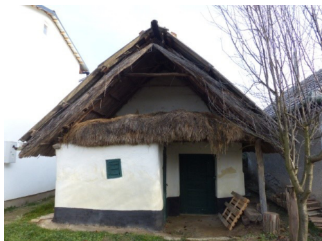
Obr. 4: Vinohradnícke domčeky s vínnymi pivničkami (Moyzeová, 2020).